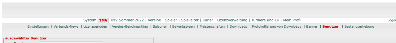
Abb.1.4 - Einrichten der Berechtigungen für Benutzer